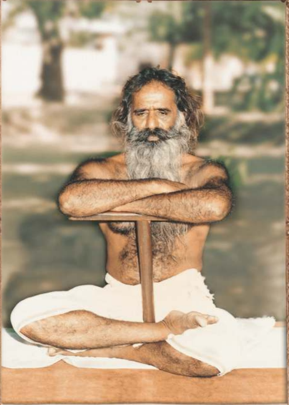
श्री स्वामी अड़गड़ानन्द जी महाराज